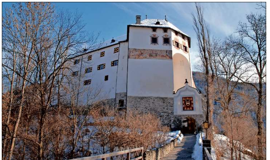
Il casti da Razén ei staus duront tschentaners sedia da baruns, castellans ed administraturs. 323 onns, da 1497 tochen 1819, ha il Signeradi s'udiu all'Austria.