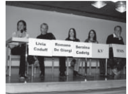
Schülerinnen und Schüler berichten über Ihre Erfahrungen an der Handelsschule.