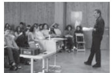
Projektarbeiten über das Entwicklungskonzept Surselva in der Aula