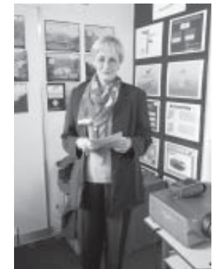
Die Handelsschule Surselva war an der EX-01 in Disentis vertreten - Unsere Schulräte orientieren Besucher