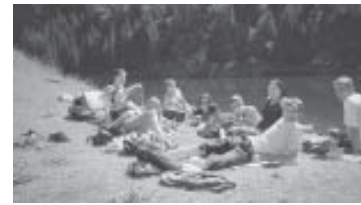
K3 am Wandertag