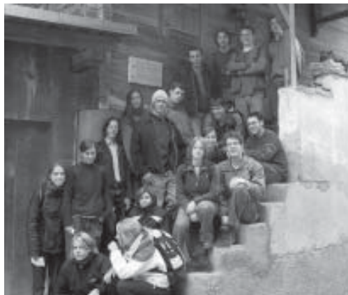
Geschichte vor Ort - Die Klasse H3 in Waltensburg