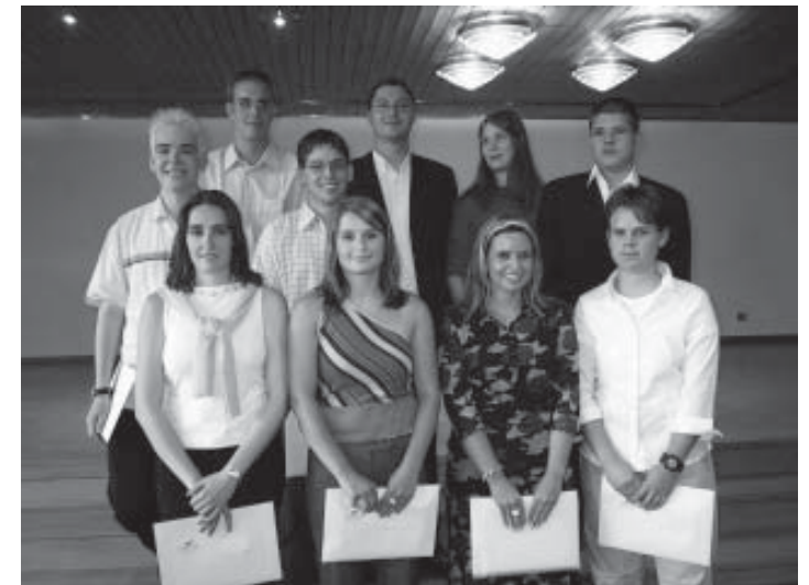
HMS+ Berufsmatura 2002