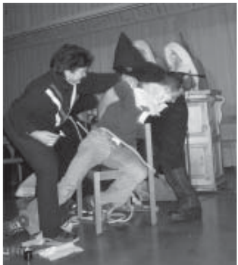
Aus der Niklausfeier - organisiert von H3