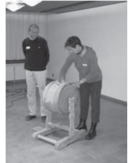
Verlosung Hauptgewinn Wettbewerb EX01