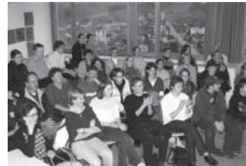
Eltern und Lehrmeister besuchen den Unterricht.