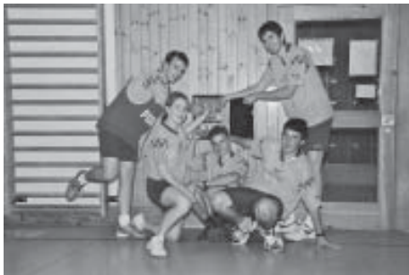
Sportgruppe in der Turnhalle