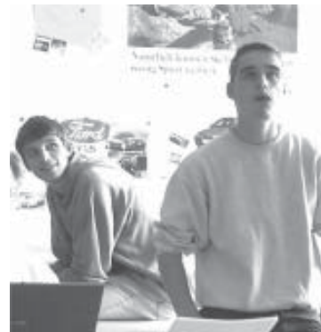
Vortrag über Versicherungen