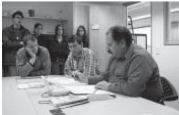
Viseta tier la redacziun dalla Quotidiana