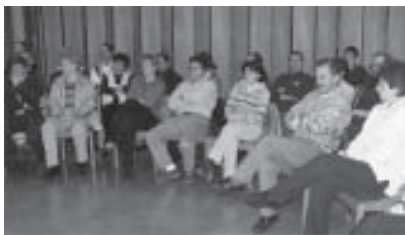
Schülerinnen und Schüler stellen ihre Eltern vor.