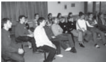
Praxisseminar 2001 für HMS+