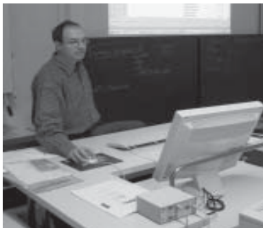
Neue Informatikanlage an der Handelsschule Surselva