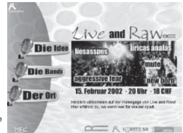
Als Projektarbeit wurde ein Konzert in Laax durchgeführt. Der Erlös wurde der Maibach-Stiftung überwiesen.