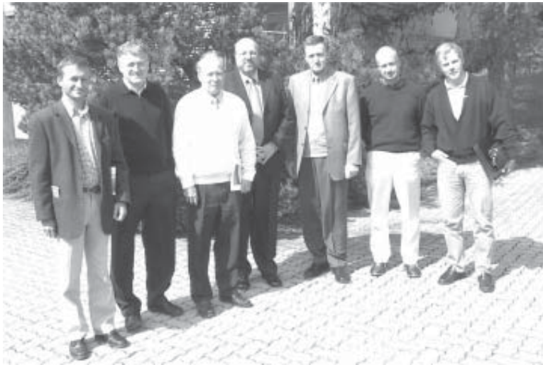
Am 11./12. September fand die Bündner Handelsschulrektorenkonferenz in unserer Schule statt.