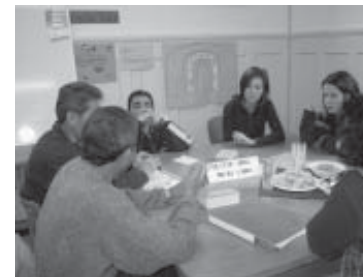
Besuch im Asylantenheim - H1