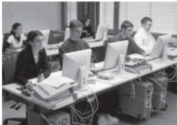
K3 im Informatikzimmer