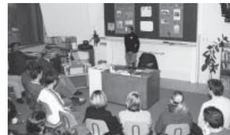
Geschichte vor Ort - H3 informiert über das Projekt.