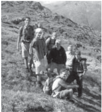
Auf dem Weg zum Muraun (Wandertag)