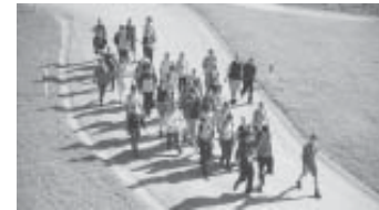
Schüler unterwegs zum Lag da Laus