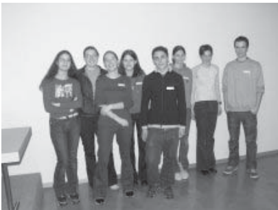
Klasse M1 (Elternabend)