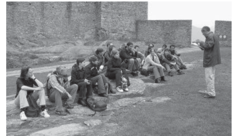
Kulturhistorische Exkursion in Bellinzona (H3)