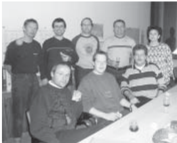
Lehrergruppe anlässlich einer Lehrerkonferenz