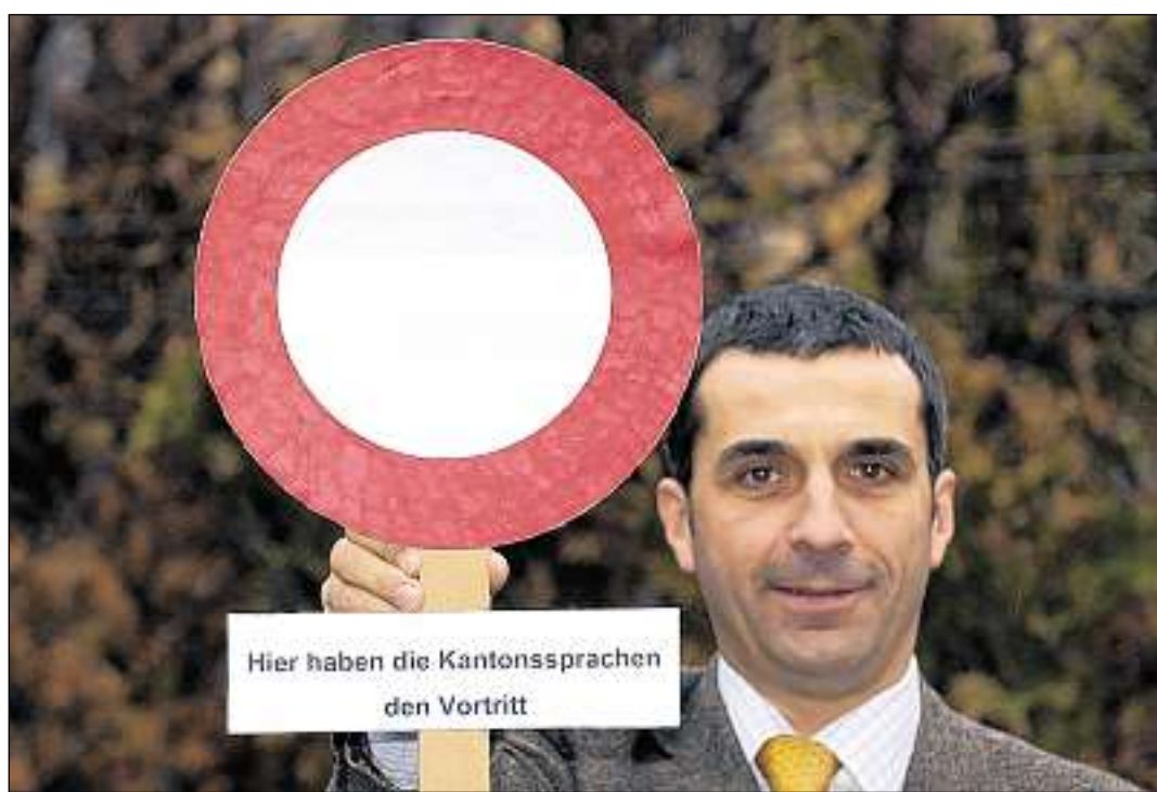
Resguardond la trilinguitad grischuna duai il talian restar emprima lingua estra en las scolars tudestgas.