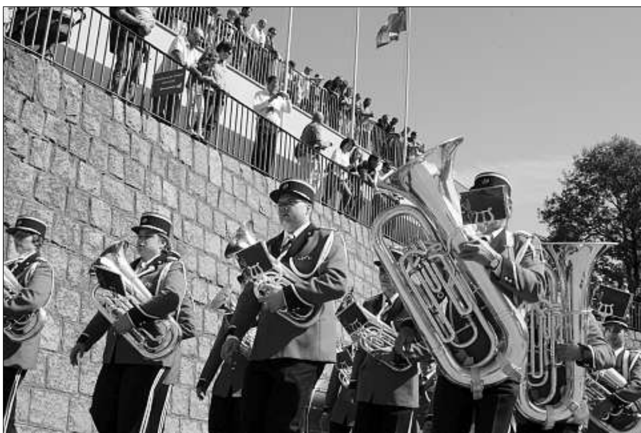
Las societads da musica gaudan bia simpatia els vitgs. Tuttina han ellas breigias da recrutar novas musicantas e novs musicants.

Las finamiras tschentadas ein strusch da contonscher senza attractivar la scena da musica en Surselva. Quei han ils responsabels constatau. La scola da musica e las societads vulan elaborar projects per camps da musica, ensembles ed ina musica da giuvenils. Duront la scolaziun duein ils musicants haver la caschun da concertar en differentas formaziuns.