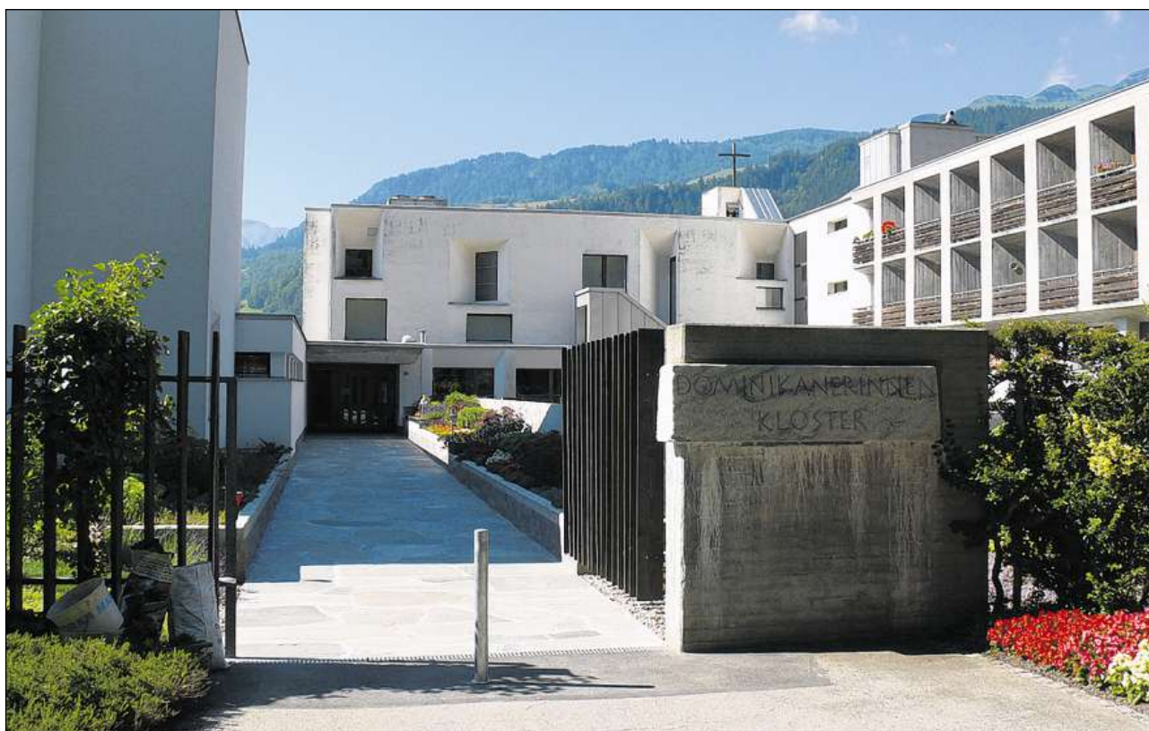
Localitads dalla claustra a Glion surveschan egl avegnir al Cuors romontsch sursilvan dalla Fundaziun Retoromana Pader Flurin Maissen.